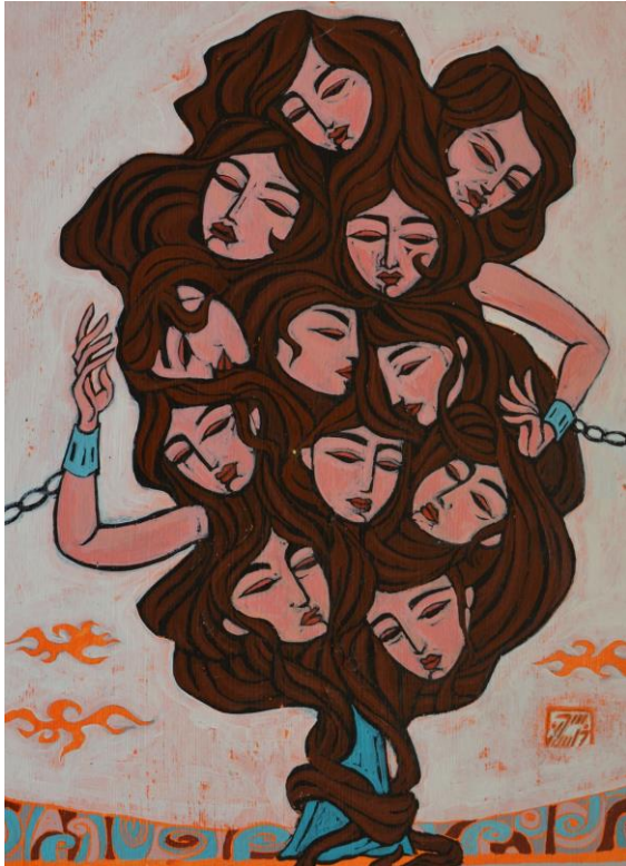
© Sahar „Waiting to grow up my inside woman“

Im Frühjahr war das künstlerischen Forschungsprojekt MAPPING THE UNSEEN, unterstützt und basierend auf schau.Räume_global, im öffentlichen Raum Villachs, online und in einer Galerie Villachs zu erleben. Die Veranstaltungen hatten das Thema „Diskriminierung“.