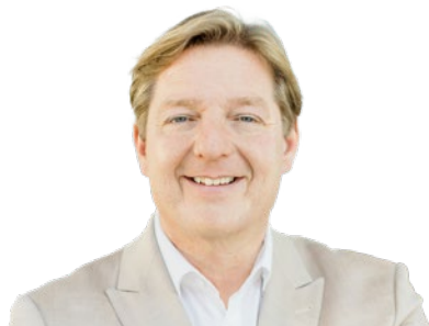
Bürgermeister Günther ALBEL